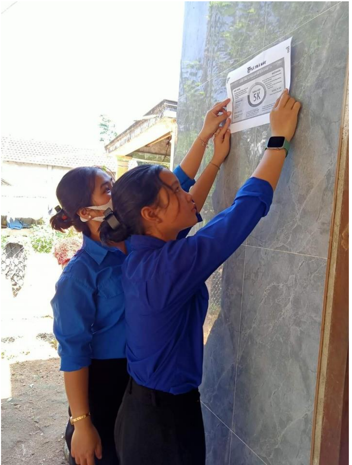
Tại Hiệp Đức, tuổi trẻ toàn huyện ra quân phát quang, nạo vét 8km đường,