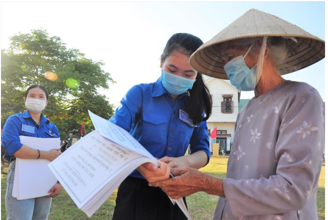
Những màu áo xanh trở nên đẹp đẽ, thiêng liêng trong ngày hội non sông. Họ đã tích cực, chủ động và nhiệt thành với công việc, trở thành một cánh tay đắc lực không thể thiếu tại mỗi điểm bầu cử.